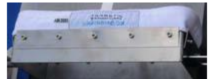
采样网固定装置, 更换简单